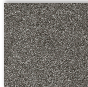
95 4m + 5m