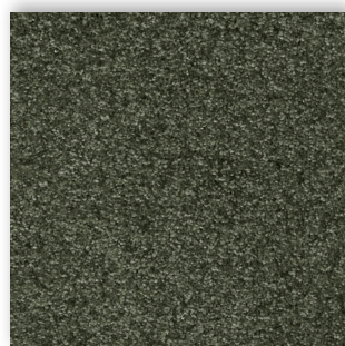
24 4m + 5m