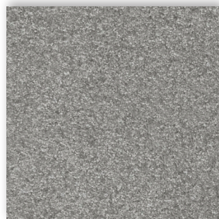
92 4m + 5m