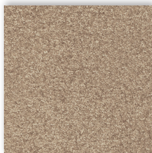
35 4m + 5m