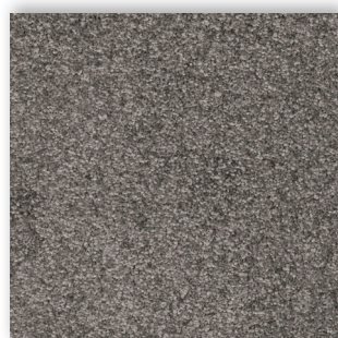
98 4m + 5m