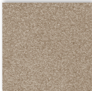
39 4m + 5m