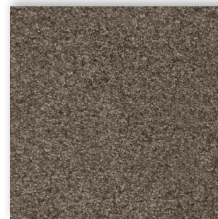
97 4m + 5m