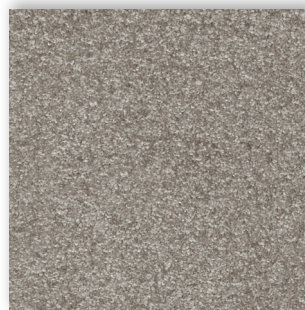
49 4m + 5m