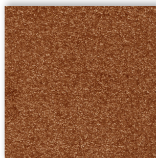
80 4m + 5m