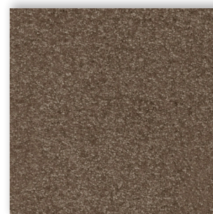
42 4m + 5m