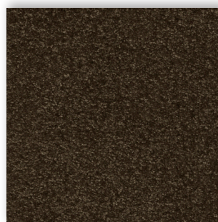
44 4m + 5m