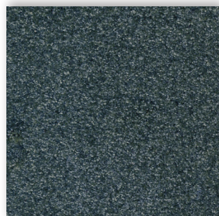
77 4m + 5m