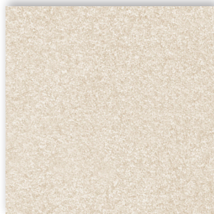
02 4m + 5m